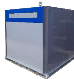
Colonne aérienne pour les cartons bruns