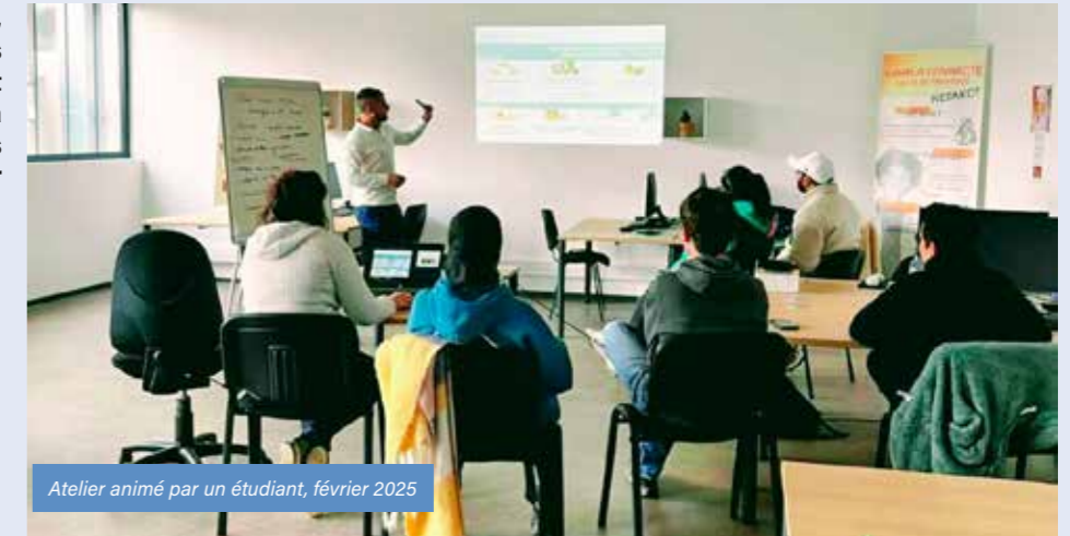
Atelier animé par un étudiant, février 2025

Installé depuis la rentrée de septembre 2024, dans des locaux modernes situés au rez-de-chaussée de la Communauté de Communes à Valréas, le Campus Connecté est équipé d'un accès Internet très haut débit et de tout