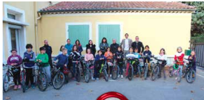
Les écoliers de Montbrison-sur-Lez à l'issue de leur formation

L'apprentissage du vélo en toute sécurité fait partie des actions prioritaires définies par les élus de la CCEPPG. Depuis la rentrée scolaire 2024, la CCEPPG déploie le dispositif «Savoir Rouler à Vélo» dans les classes de CM2 des écoles volontaires du territoire. À l'issue des 15 heures de formation, réparties en trois sessions encadrées, chaque enfant reçoit un diplôme et une sonnette à fixer sur son vélo, symbole de son engagement pour une mobilité plus autonome et responsable.