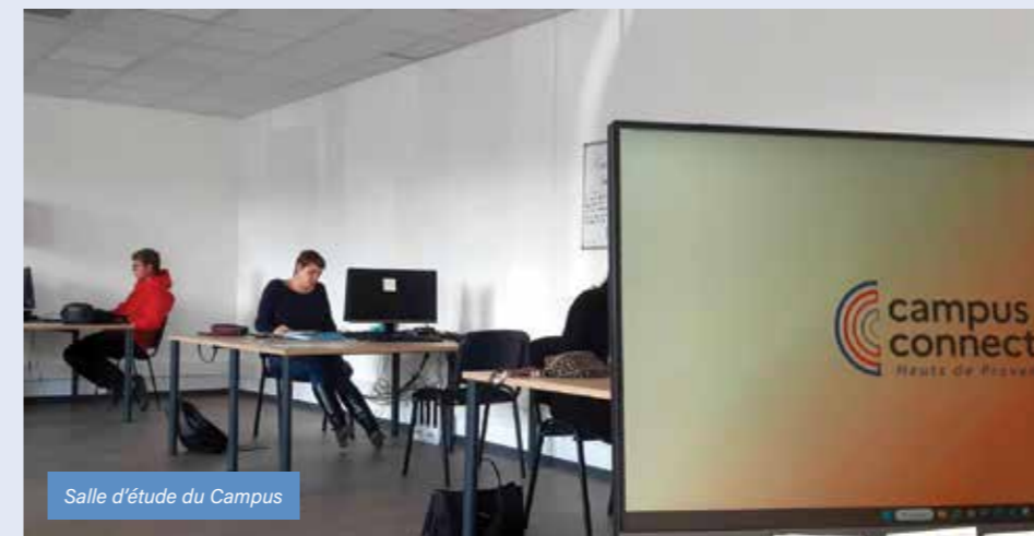
Salle d'étude du Campus