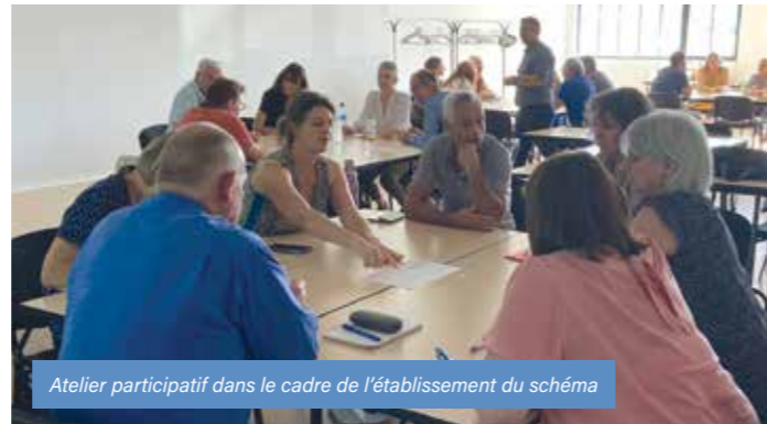
Atelier participatif dans le cadre de l'établissement du schéma

Cette initiative, animée par le Comité Départemental de la Drôme (Codep26), rencontre déjà un vif succès. En effet, après l'école de Montbrison-sur-Lez à l'automne, les écoles de Grignan et Saint-Pantaléon-les Vignes verront leurs sessions s'achever en mars. Enfin, si l'opération est en cours à Visan, les écoles de Taulignan, Réauville, Richerenches et Roussas réaliseront leurs cycles avant les vacances d'été. Toujours en lien avec cette thématique, certaines écoles prévoient des projets d'envergure pour le printemps, portant sur l'organisation d'un tour de l'Enclave à vélo ou une sortie de deux à trois jours.